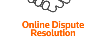
Online Dispute Resolution